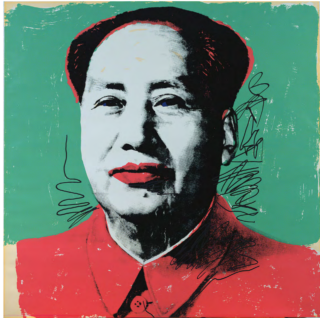
Andy Warhol: Mao , 1972, serigrafia/serigrافی, 91,5 x 91,5 cm