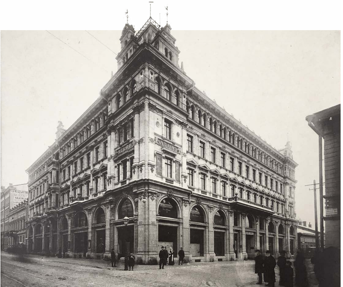
► Vuonna 1891 valmistunut Atlas-talo Helsingissä Aleksanterinkadun ja Mikonkadun kulmassa