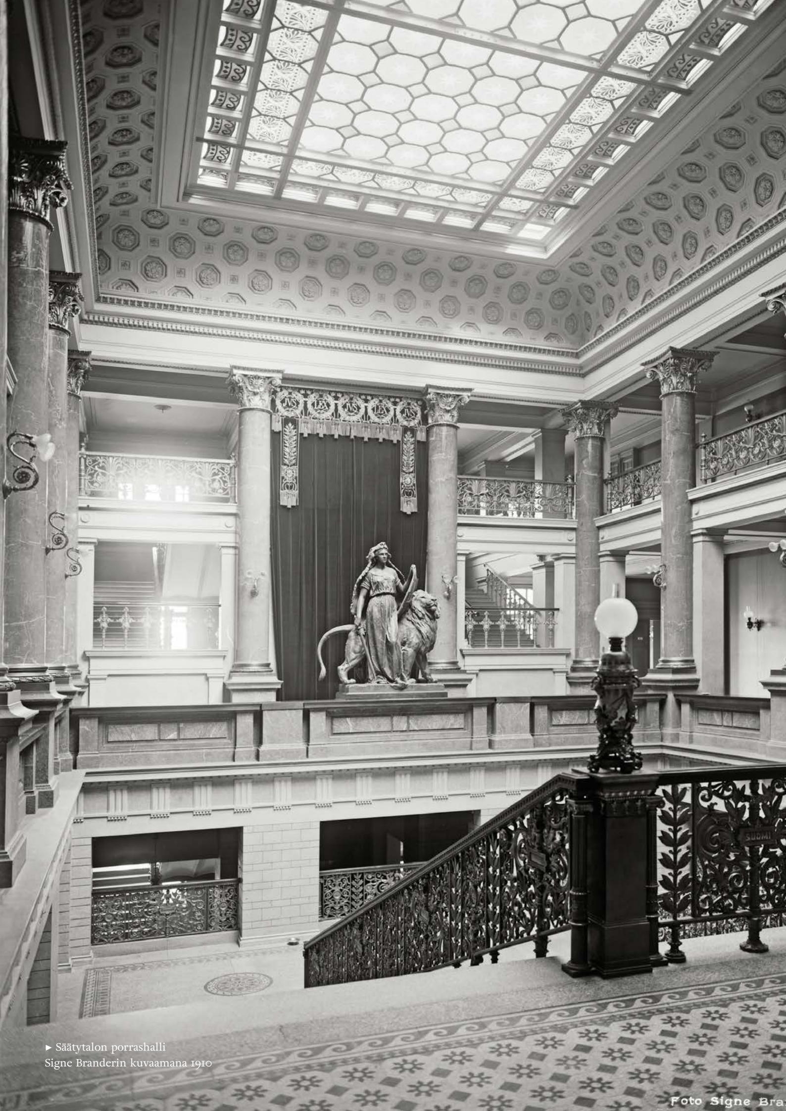
► Säätösalon porrashalli 1910